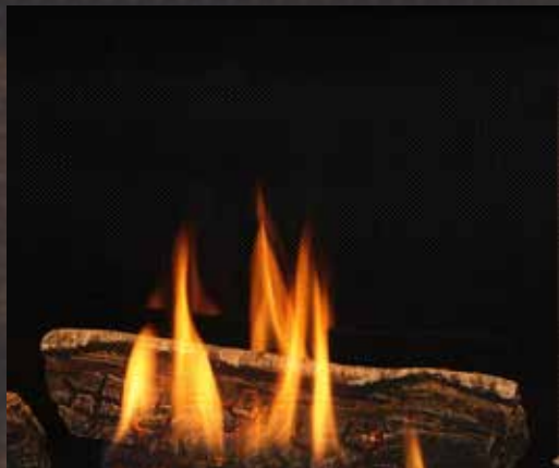
Verre noir avec bûches de bouleau

Choix de panneaux réfractaires et de jeux de bûches