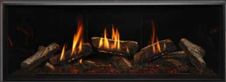
Bûches de bouleau avec écran de façade standard