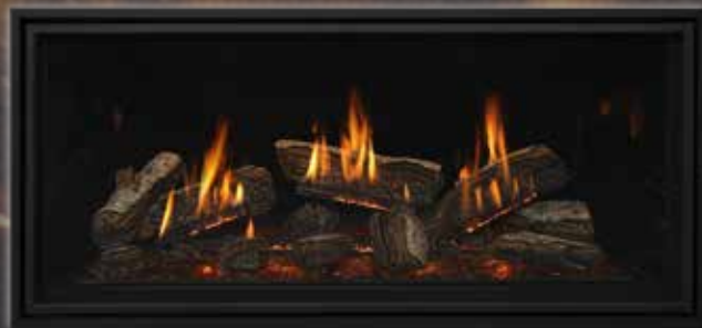
Bûches de bouleau avec avec contour rectangulaire en option