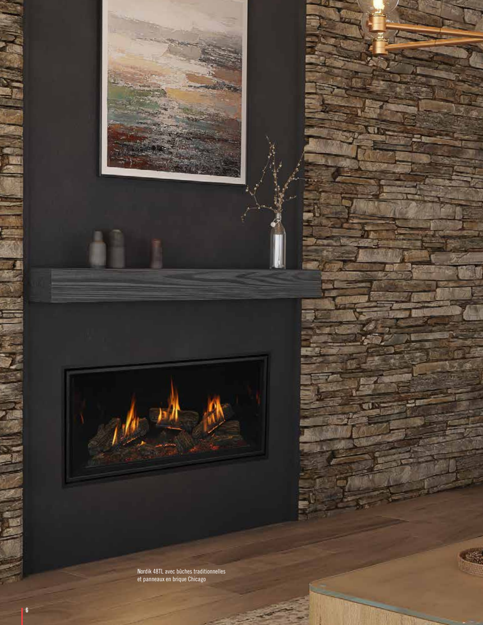
Nordik 48TL avec bûches traditionnelles et panneaux en brique Chicago