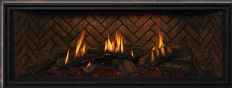
Bûches traditionnelles avec contour rectangulaire en option