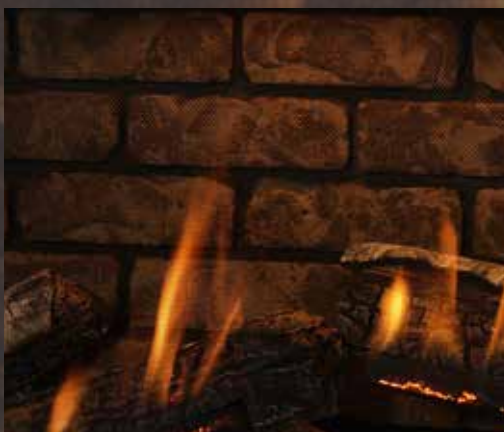
Brique Chicago avec bûches de bouleau