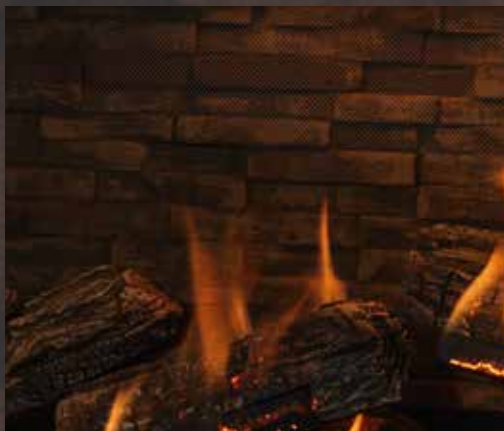
Ledgestone avec bûches traditionnelles