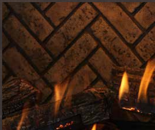
Herringbone avec bûches traditionnelles