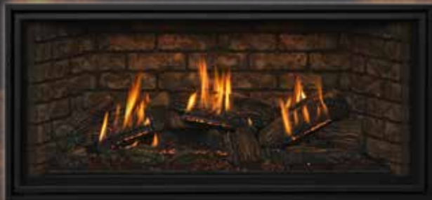
Bûches traditionnelles avec écran de façade standard