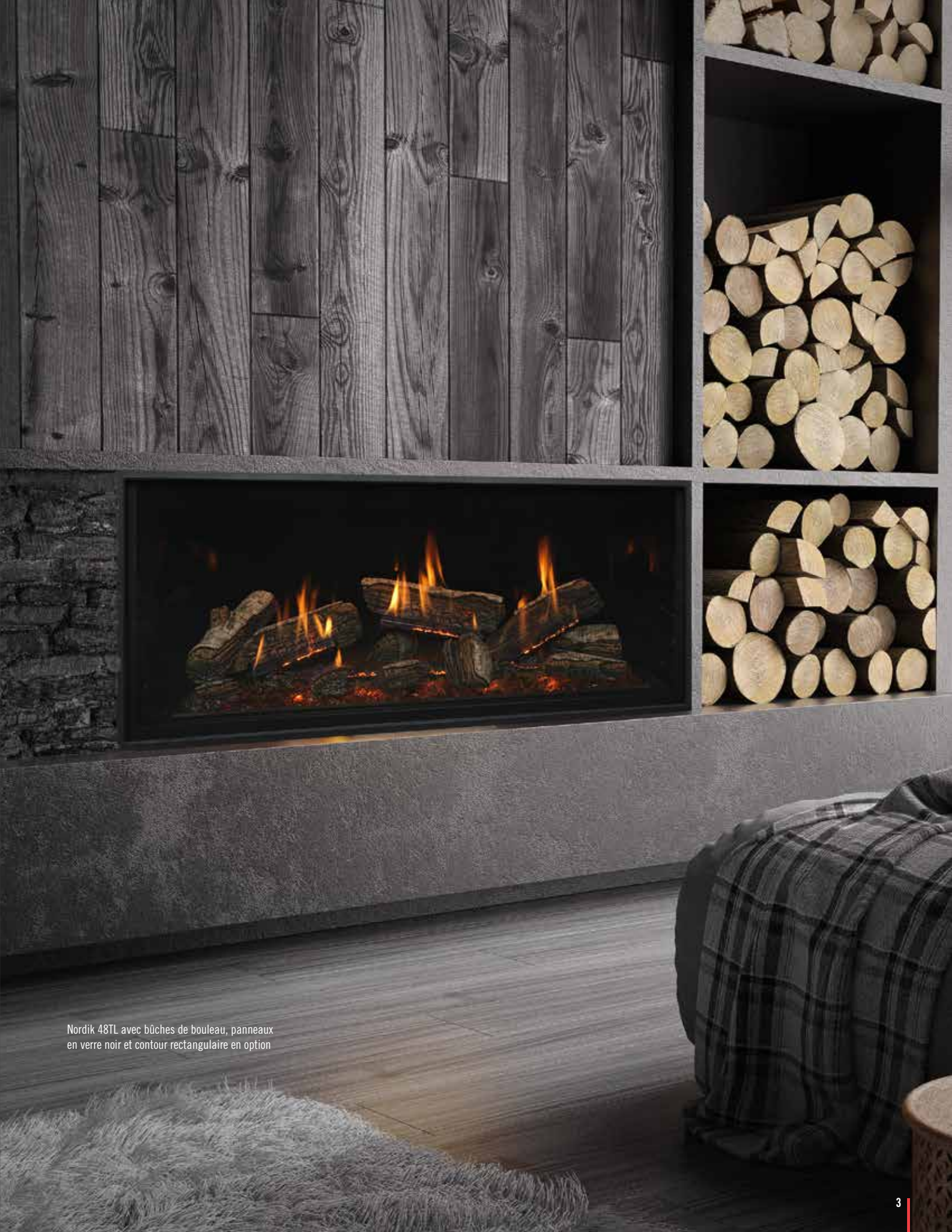
Nordik 48TL avec bûches de bouleau, panneaux en verre noir et contour rectangulaire en option