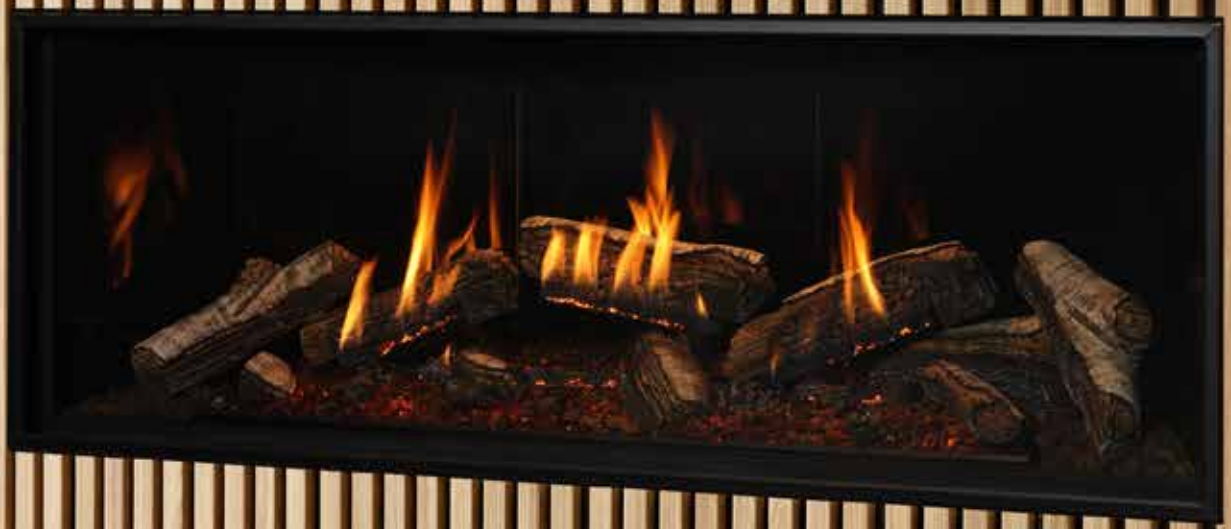
Nordik 60TL avec bûches de bouleau et panneaux en verre noir