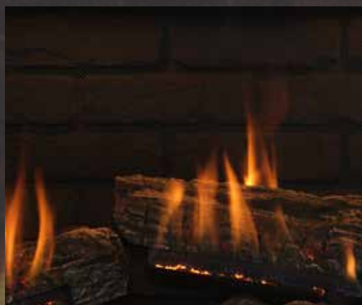
Brique noire avec bûches traditionnelles