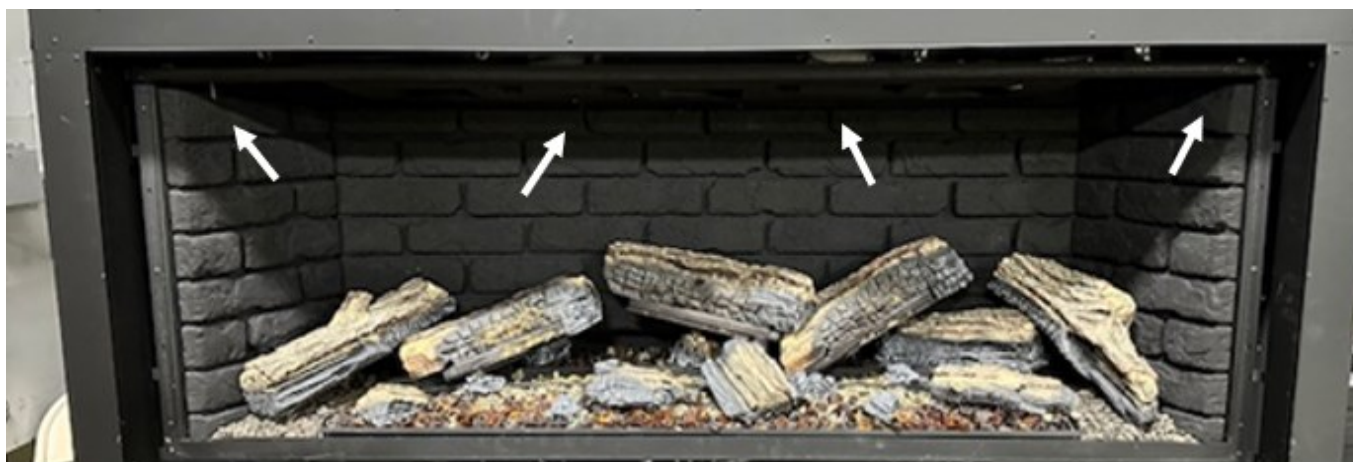
Figure 4 - Emplacement des clips de panneaux