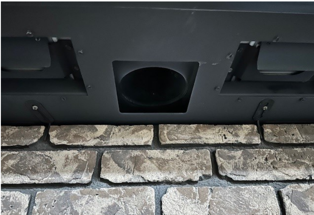
Figure 6 - Emplacement et installation d'un clip de panneau arrière