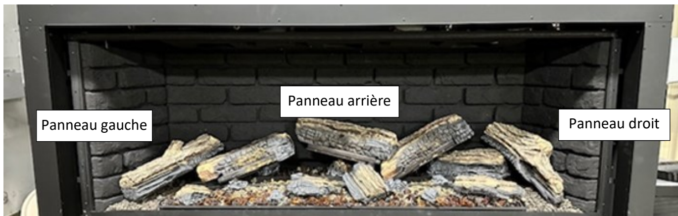
Figure 3 - Identification des panneaux