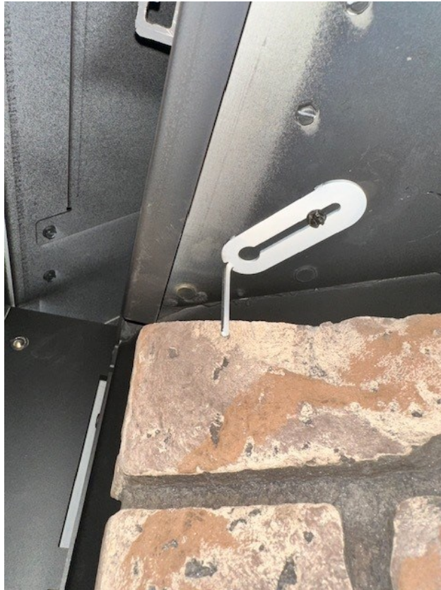
Figure 5 - Emplacement et installation d'un clip de panneau latéral